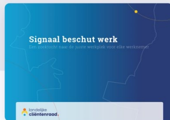
Signaal beschut werk

De LCR bedankt alle burgers die hun ervaringen met ons hebben gedeeld. We bedanken ook alle uitvoeringsorganisaties, lidorganisaties, ambtenaren en onderzoekers die hebben bijgedragen aan de signalen. In 2023 worden nieuwe onderwerpen gepubliceerd.