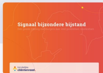
Signaal Bijzondere bijstand